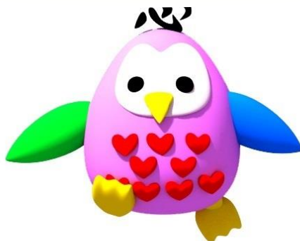
津市社会福祉事業団マスコットキャラクター ふくちゃん